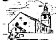
St. Michael Schwarzenbach