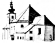
St. Bartholomäus Hohenthau