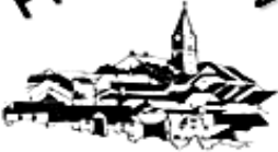
St. Nikolaus Barnau