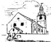
St. Michael Schwarzenbach