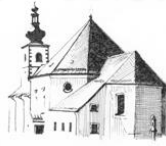
St. Bartholomäus Hohenthau