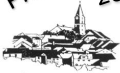
St. Nikolaus Bärnau