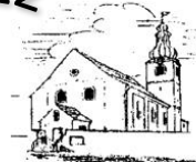
St. Michael Schwarzenbach