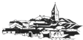
St. Nikolaus Bärnau