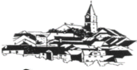
St. Nikolaus Bärnau