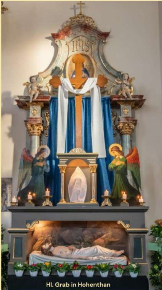
Hl. Grab in Hohenthan