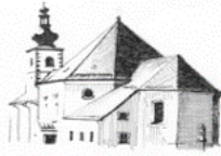
St. Bartholomäus Hohenthau