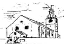
St. Michael Schwarzenbach