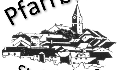
St. Nikolaus Bärnau