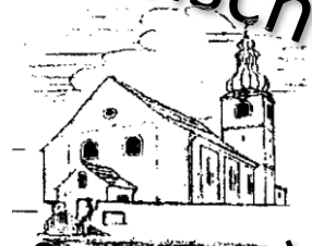
St. Michael Schwarzenbach