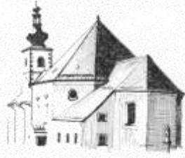
St. Bartholomäus Hohenthau