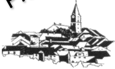
St. Nikolaus Bärnau