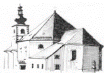
St. Bartholomäus Hohenthau